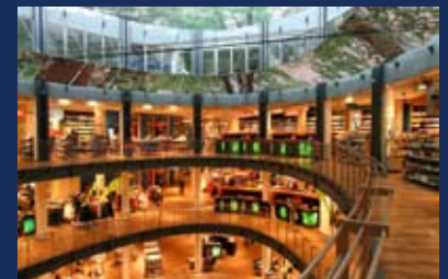
Die Globetrotter-Filiale in der Domstadt treibt erlebnisorientierte Markenführung auf die Spitze