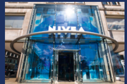
Das Nivea-Haus im Herzen Hamburgs bietet auf drei Etagen Markenerlebnisse pur

Erleben Sie bei Ihrem nächsten Aufenthalt in Hamburg bekannte Marken hautnah. Besonderes Highlight in der Hansestadt ist das an der Binnenalster gelegene Nivea-Haus, das auf drei Etagen Nivea-Pflege pur bietet. Daneben warten in Hamburg u.a. das Fresta Bistro, der Maggi Kochstudio-Treff und das Langnese-Café auf Ihren Besuch. Exklusiv für Sie, unsere MC-BRANDNEWS-Leser, haben wir wieder einen kurzweiligen Markenlehrpfad zusammengestellt. Sehen Sie mit eigenen Augen und erleben Sie mit allen Sinnen, wie Unternehmen ihre Marke inszenieren, und lassen Sie sich für Ihre eigene Markenarbeit inspirieren.